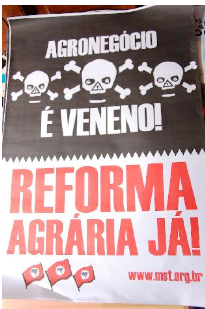
Affiche de la campagne pour la réforme agraire au Brésil.

Les paysans sans terre n'en sont pas moins actifs pour réclamer leurs droits. Malgré la criminalisation dont ils font l'objet, de nombreux mouvements de paysannes et paysans réclament des terres à cultiver, occupent des terres pour produire des aliments pour leurs familles et leurs communautés et exigent de leurs autorités des législations foncières justes. On retrouve de tels mouvements de résistance dans de très nombreux pays du monde tels que le Brésil, le Paraguay, la Bolivie, le Honduras, le Nicaragua, l'Indonésie, la Thaïlande, l'Inde ainsi que dans la plupart des pays africains comme nous le constatons lors de cette conférence.