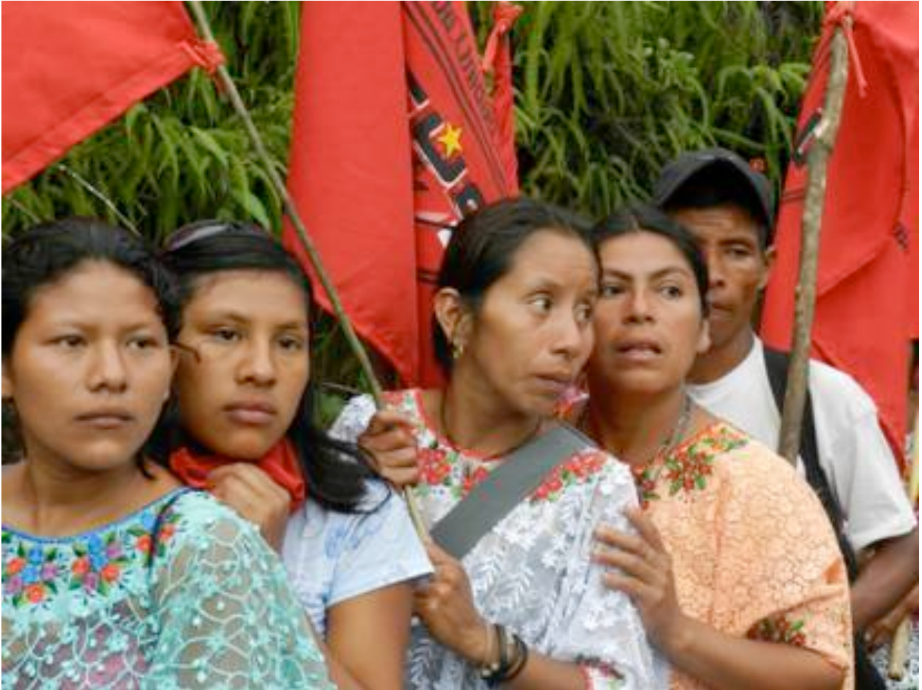
Marche vers la capitale du Guatemala des paysans et paysannes expulsés de leur terre pour revendiquer leur droit à la terre. Mars 2012.

Le grand capital criminalise les mouvements sociaux. Au Honduras, 50 paysans ont été assassinés en une année (2010-2011). Au Guatemala, les paysans sont expulsés et perdent leurs terres et leurs habitations; trois personnes ont été assassinées et beaucoup emprisonnées.